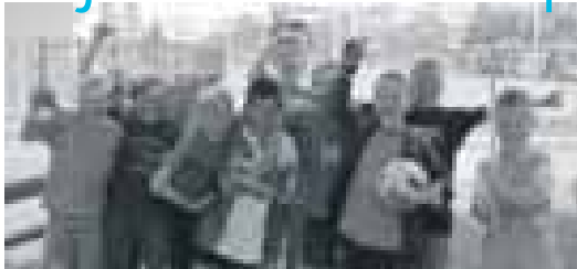
De wijk moet natuurlijk ook kindvriendelijk blijven.

Wat heeft de wijk nodig. De samenwerkingsafspraken tussen deelgemeente en corporaties komen natuurlijk niet uit de lucht vallen. Ze zijn gebaseerd op de Wijkvisie Zevenkamp. Deze Wijkvisie is een overkoepelend beleidskader van de deelgemeente en de corporaties waarin staat beschreven wat er in de wijk moet gebeuren. De laatste Wijkvisie is alweer een paar jaar oud en wordt daarom binnenkort vernieuwd. De nieuwe Wijkvisie zal voor een deel gaan over Nesseland en welke kansen de komst van deze nieuwe wijk, Zevenkamp biedt. Denk bijvoorbeeld aan het vergro-