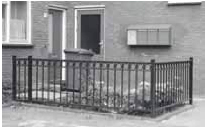
De opknapbeurt geeft ook een gevoel van veiligheid, want het ziet er toch weer netjes uit.

Ook kunt u terecht bij de Bewonersorganisatie Zevenkamp en of het Opbouwwerk. Telefoon 010-2892400.