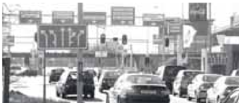
Zonder borden weet je je geen raad, maar met al die borden is het ook niet alles.

De procedure In januari en februari zijn drie inspraakavonden gehouden waarvoor gericht bewoners zijn uitgenodigd om hun ervaringen te vertellen. De bewoners die zijn uitgenodigd zijn reeds op verschillende terreinen in de wijk actief. Van hen mag dus een gedegen inbreng worden verwacht. (Bij het ter perse gaan van deze Bugel waren de resultaten van de drie avonden nog niet bekend). Met de opbrengst gaat ES&E aan de slag. Allereerst zullen zij een en ander gaan vergelijken