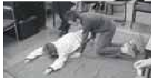
Inde juiste houding leggen (bovenboven) is een van de eerste stappen. Een mitella knopen (boven) vergt ook zijn techniek. Contact maken (links) na een ongeval.