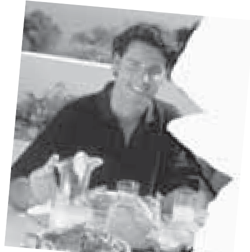
Gemeenschap van goederen: eerlijk zullen we alle sdeien, teer, de...ft.

Wanneer het een huurwoning betreft moet het huurcontract worden aangepast zodat het voortaan uitsluitend op naam van degene die er blijft wonen staat. En daarmee is het dan geregeld. Wanneer het een koophuis betreft is het iets lastiger. Er kan worden verkocht, waarna de hypotheek wordt afgelost en het restant wordt gedeeld. Wanneer een van de twee er blijft wonen moet