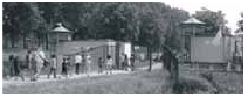
In Takatukaland is het jong geleerd, oud gedaan.

tal voorzieningen in de wijk, waarbij te denken valt aan het lid worden van sportclubs maar ook het lenen van video's. Dit bijzondere initiatief heeft de belangstelling van de buitenwereld gewekt, voor de AVRO was dit zelfs reden genoeg om er een serie televisie-uitzendingen aan te wijden.