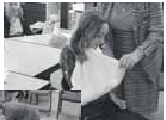
De beademing (boven de aanzet hiertoe) was wel het spannendste onderdeel. Een vingerverbandje aanleggen is toch moeilijker dan je denkt. (links)