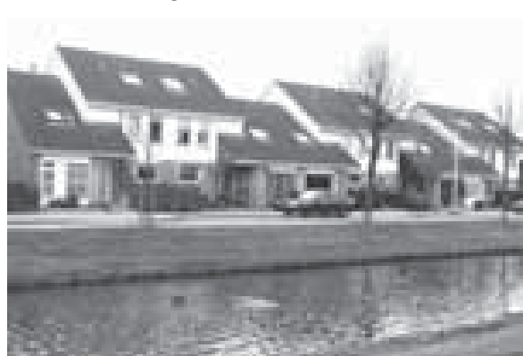
Aan sommige huizen van Orion zie je niets bijzonders...

Dit idee bleek te kloppen. Mensen met een handicap, die er werkten en woonden, bleken een veel menswaardiger leven te kunnen leiden. De Camphill beweging is sindsdien enorm gegroeid met meer dan honderd plaatsen over de hele we-