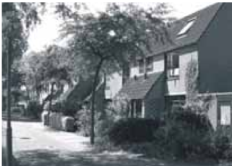
De straat weer keurig, de huizen veilig gemaakt met behulp van het politiekeurmerk.

binnenruimten. Het WBR kan dit niet alleen doen omdat de buitenruimte voor een deel eigendom is van de deelgemeente. De deelgemeente zelf heeft natuurlijk ook plannen en budgetten voor de herinrichting van de buitenruimte. Deze plannen komen niet altijd overeen met de eisen van het politiekeurmerk. Per gebied of huizenblok zal de deelgemeente dan ook bekijken wat er verbeterd moet worden en zo ja, wanneer dat gaat gebeuren. Uitgangspunt voor de deelgemeente is het gezamenlijk belang en het streven naar een groter gevoel van veiligheid voor iedereen.