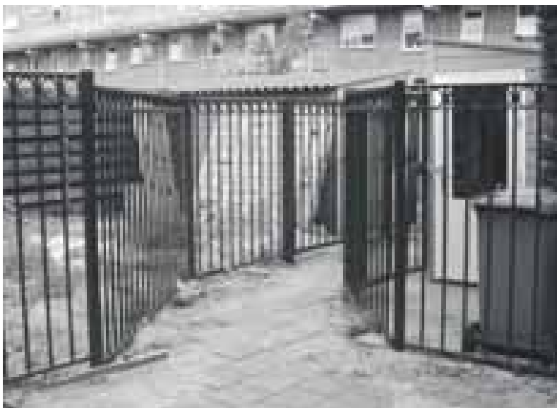
Ook de achtertuinen werden niet vergeten, verder is het aan de bewoners.

In de wijk Zevenkamp maken vele bewoners zich sterk voor bijvoorbeeld hun buurtje, straat, portiekgalerij of flat. Er wordt niet alleen veel gepraat maar ook veel ondernomen. Alleen of met steun van een huisbaas, een gemeentelijke dienst, de deelgemeente, de bewonersorganisatie Zevenkamp, het opbouwwerk en of anderen is en wordt er heel veel bereikt.