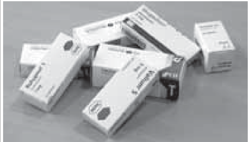
Zoveel soorten zoveel uitingen.

Verslaving, gewenning, lichame-lijk en/of geestelijk. Iedereen heeft wel een verslaving aan bijvoorbeeld alcohol, tabak, slaapmidde-len, reizen, koffie, hard fietsen, beeldschermverslaving en al wat dies meer zij. Het hoort ook wel een beetje bij de mens. Verslaving hoeft niet echt verkeerd te zijn.