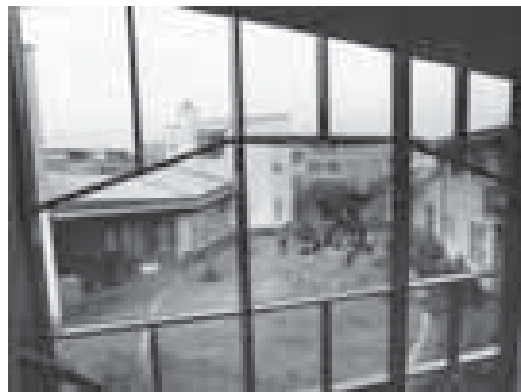
...maar er zijn ook huizen die heel anders zijn.

Dit is een eerste artikel over de woon- en werkgemeenschap Orion. Om u kennis te laten maken met deze gemeenschap zullen er de komende maanden verschillende artikelen over Orion verschijnen.