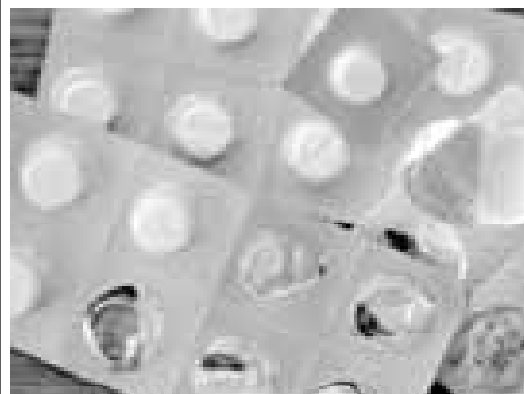
Niet gebruikte pillen inleveren ter vernietiging.

Onrust, spanning of angst Zelf kunt u wellicht uw onrust wat temperen door afleiding te zoeken zoals een kamer opknappen, lezen, fietsen of vrijwilligerswerk doen. Door uzelf te verwennen, lekker koken, jezelf opmaken, nieuw kle-dingstuk aanschaffen of naar een sauna gaan. Kunt u door uw angst de straat niet op, dan is het ontwik-kelen van een hobby een goede zaak. Want voor die hobby moet u toch materiaal hebben en daarvoor moet u de straat op. Dat hoeft niet gelijk een tocht van uren te zijn. Een boodschapje per keer kan moeilijk genoeg zijn en daarmee voldoende.