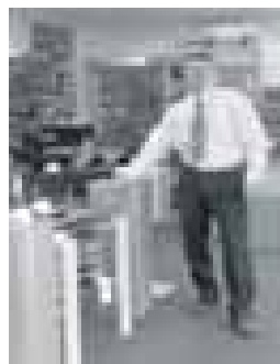
U bent van harte welkom.